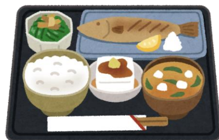
「一汁三菜」献立の例

和食は、「ご飯」「汁物」「おかず」の組み合わせが基本形です。ご飯を中心に、汁物とおかずの何品かが加わります。ご飯に味噌汁などの汁物が1品付くことを「一汁」、肉や魚などメインとなるおかず（主菜）1品と、煮物や和え物などのおかず（副菜）が1～2品付くことを「二菜」「三菜」といいます。